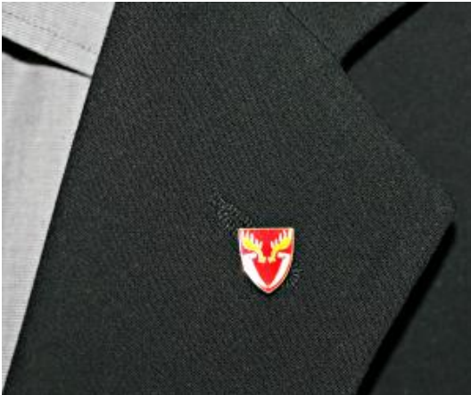
Rintamerkki: 8 € / kpl