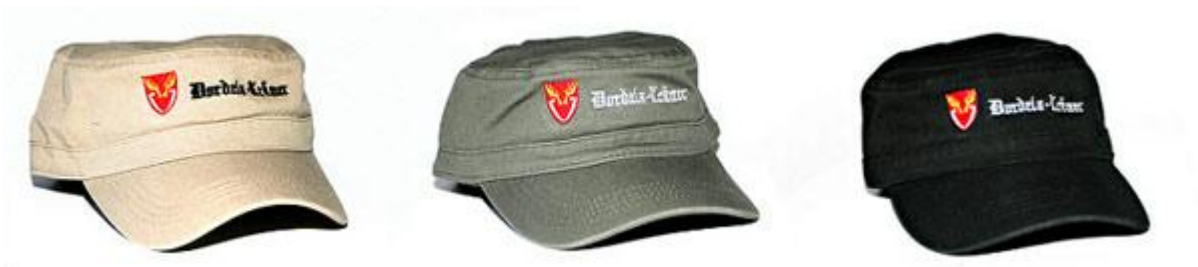
Lippialakki: 10€ / kpl (värit: beige, vihreä ja musta)