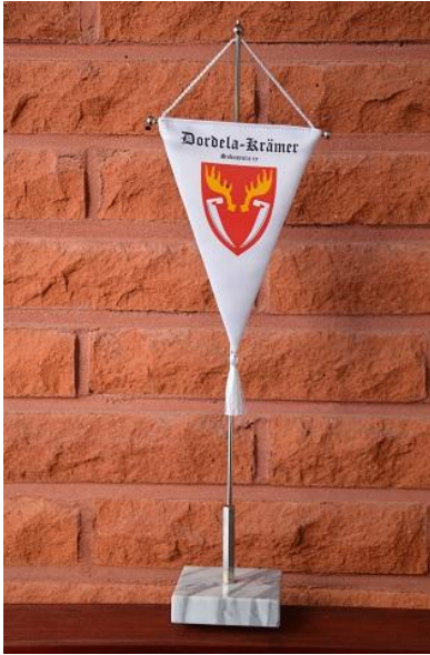
Sukuseuran pöytäviiri: 30 € / kpl

Vuosijuhlakokouksessa on tilaisuus hankkia sukuseuran tuotteita!