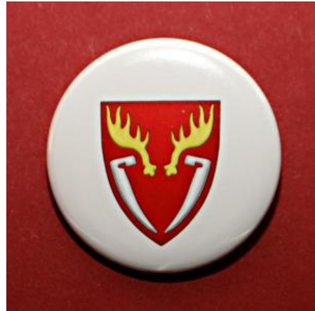
Rintanappi: 2€ / kpl