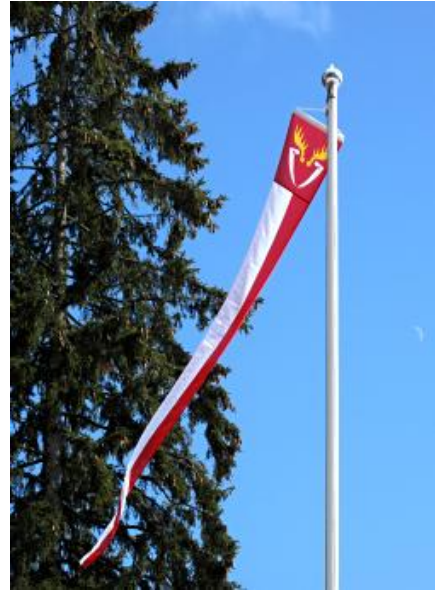
Sukuseuran isännänviiri: 100 € / kpl ( vain tilauksesta! )